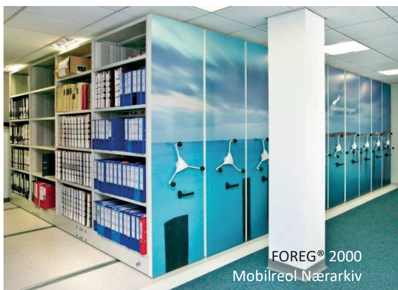
FOREG® 2000 Mobilreol Nærarkiv