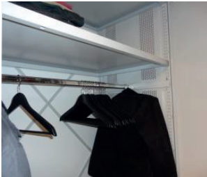
Garderobeindretning i mobilreol