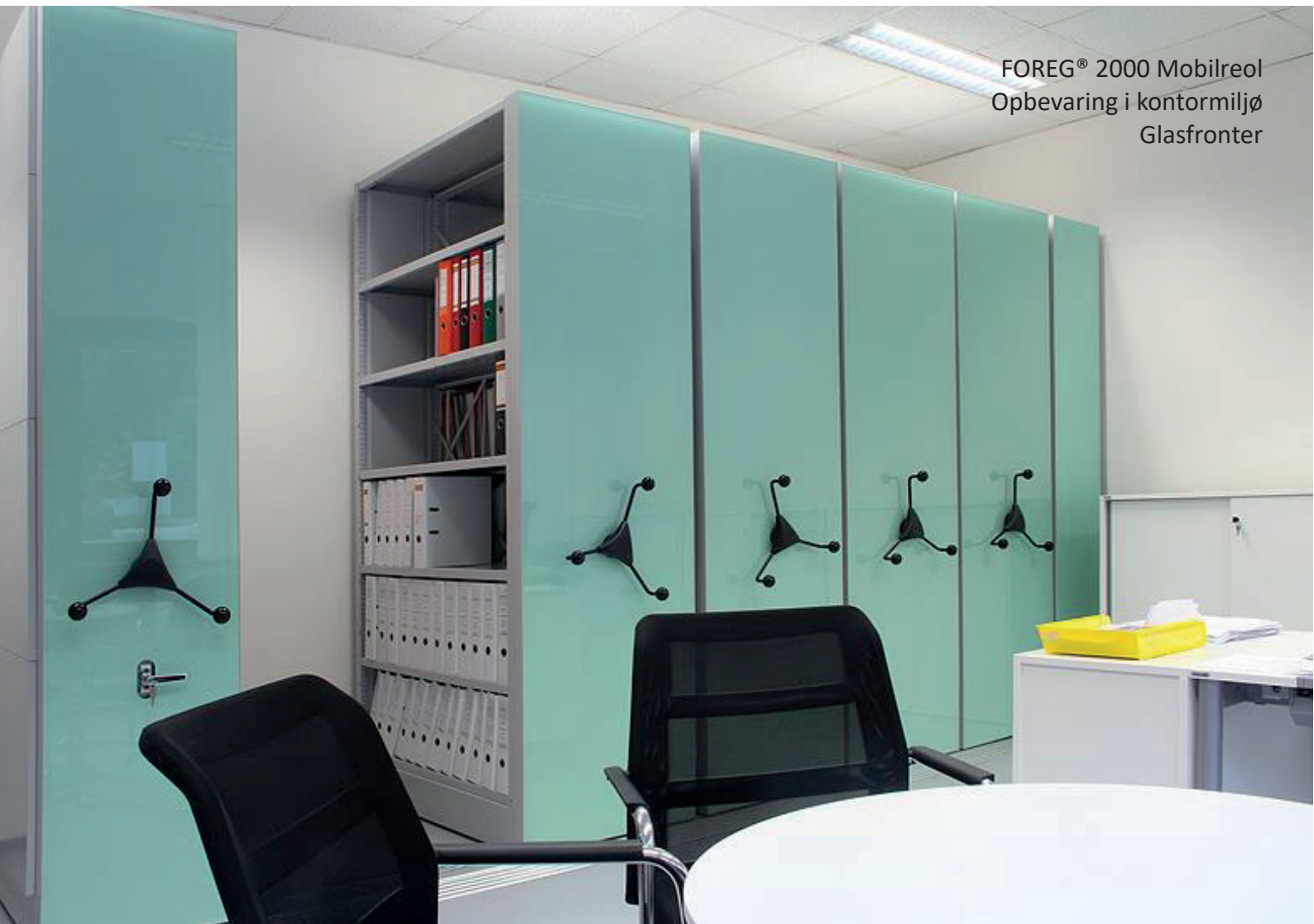
FOREG® 2000 Mobilreol Opbevaring i kontormiljø Glasfronter