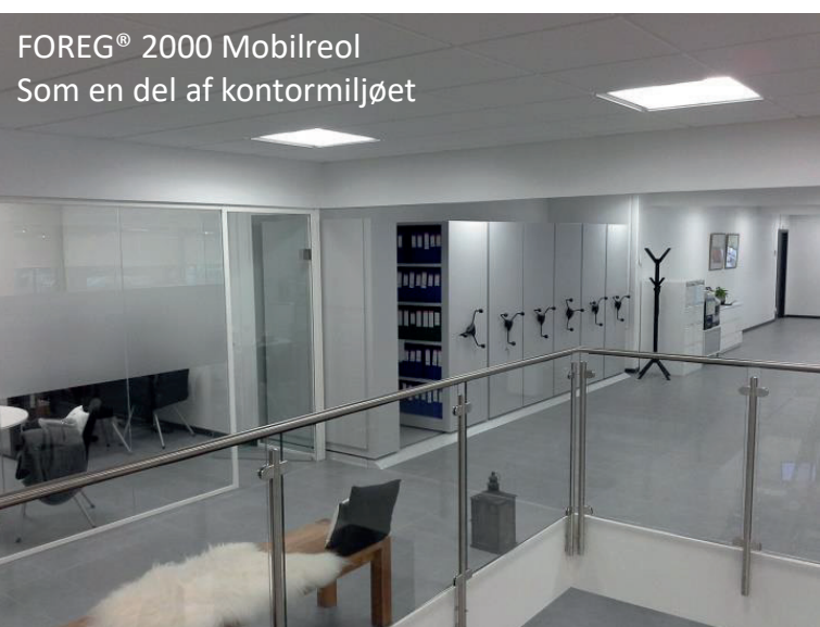
FOREG® 2000 Mobilreol Som en del af kontormiljøet